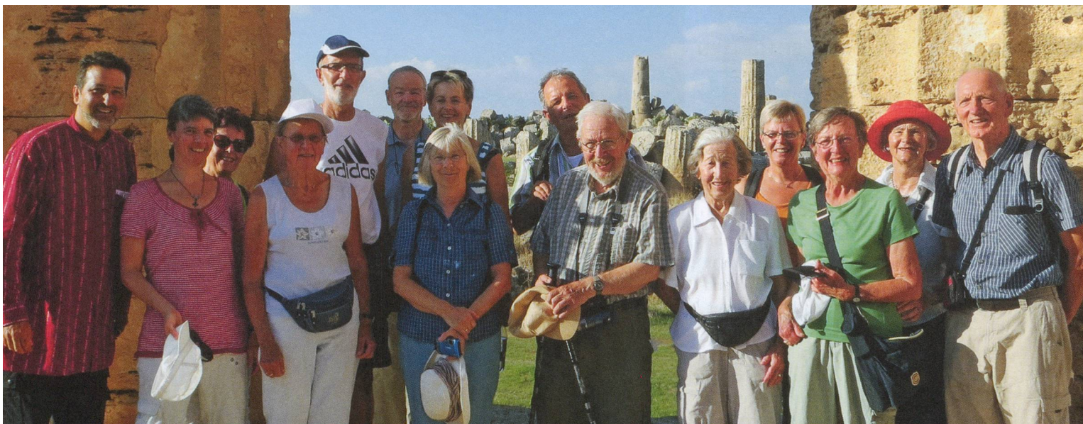
Une troupe joviale à la découverte de la Sicile : les participants au 2 e voyage culturel Parkinson ont notamment visité...