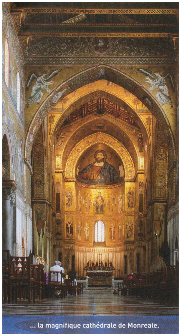
... la magnifique cathédrale de Monreale.

passer à côté du subtil pavement d'inspiration islamique semblable à un tapis de pierre.