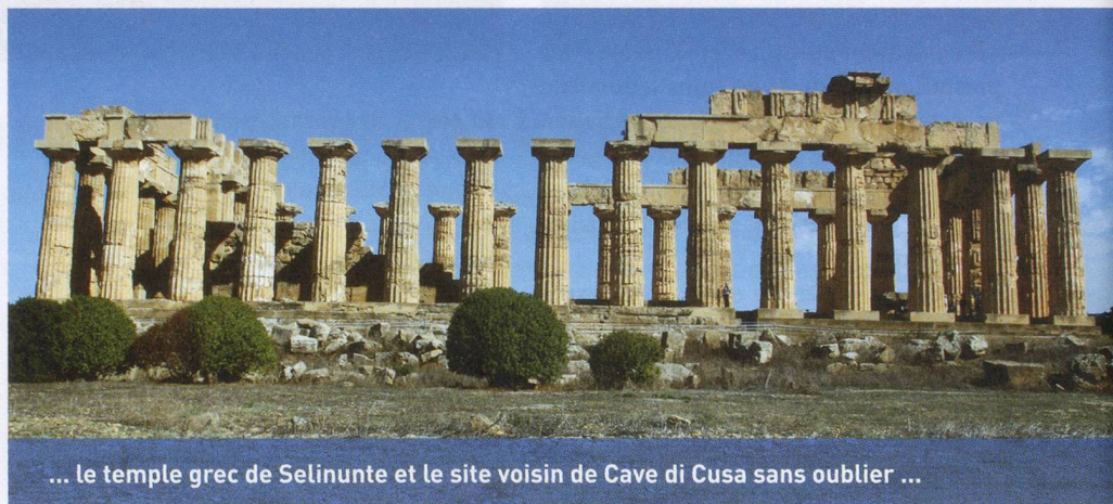
... le temple grec de Selinunte et le site voisin de Cave di Cusa sans oublier ...