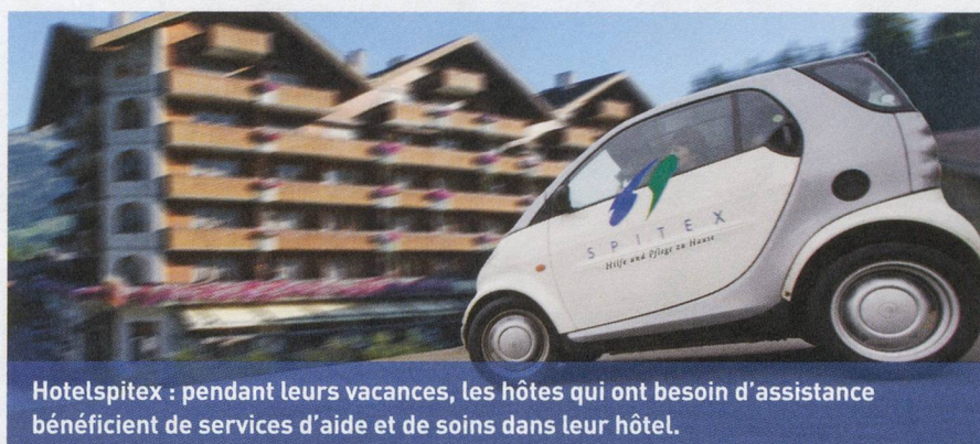
Hotelspitex : pendant leurs vacances, les hôtes qui ont besoin d'assistance bénéficient de services d'aide et de soins dans leur hôtel.