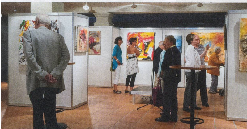
L'exposition d'art « Entre deux mondes » dans le foyer du théâtre Uri.