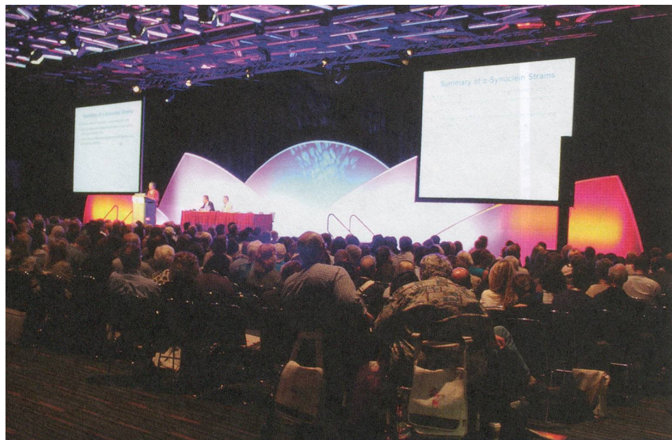
Les conférences tenues lors du 3 e Congrès mondial sur la maladie de Parkinson à Montréal ont attiré plus de 3 300 visiteurs de près de 70 pays.