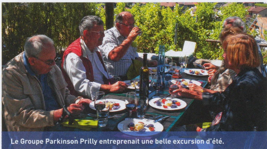
Le Groupe Parkinson Prilly entreprenait une belle excursion d'été.