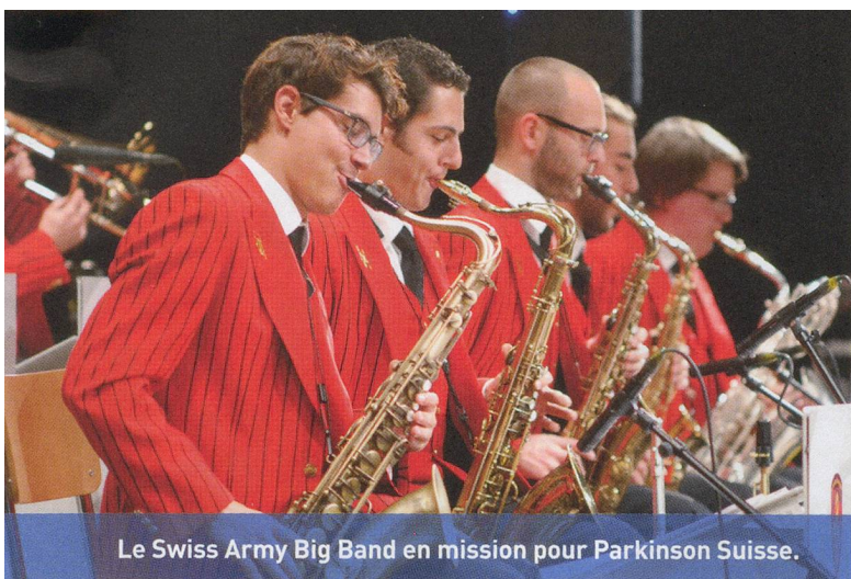
Le Swiss Army Big Band en mission pour Parkinson Suisse.