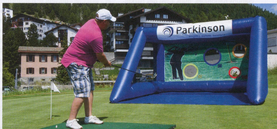
Un trou plein de suspense : les amateurs de golf ont donné 27 000 francs !