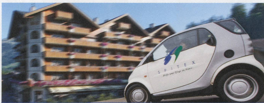
Für hilfsbedürftige Gäste kommt die Spitex während der Ferien auch ins Hotel.