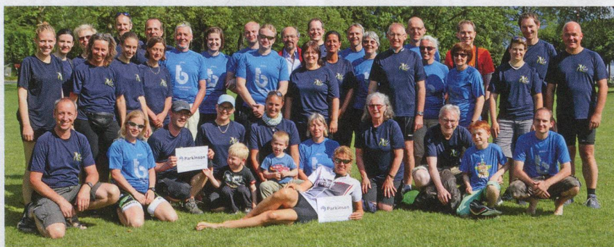
Une fois encore, l'association a été soutenue par des parkinsoniens et des collaborateurs de la CLINIQUE BETHESDA et de la « Rehaklinik Zihlschlacht ».