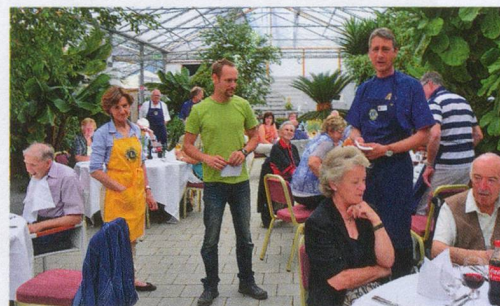
Grüner Tag: Die Lions Clubs Forch und Stäfa luden zum Feiern in die Gärtnerei.