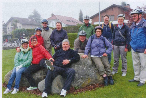
Trotzten beim Maibummel der Kälte: Die «Mutigen» der SHG JUPP Säntis.