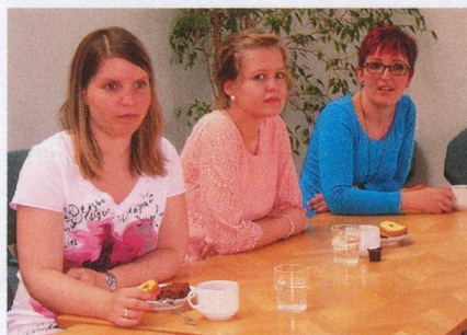
Lehrreich: Drei Logopädiestudentinnen waren zu Besuch bei der SHG Frauenfeld.

Am 8. Juni luden die Lions Clubs Stäfa und Forch die SHG Rechtes Zürichseeufer und Zürcher Oberland wieder zum Sommerausflug – es war das 15. Mal! Natürlich hatten sich die Organisatoren auch dieses Jahr wieder etwas Grossartiges ausgedacht, um den Gästen ein schönes Fest zu bieten: einen Ausflug in die Gärtnerei van Oordt, oberhalb von Stäfa gelegen, mit gemeinsamem Mittagessen und Livemusik. Und natürlich konnten die Gäste auch die interessante Ausstellung der Gärtnerei besuchen. Es war wiederum für alle ein schöner Anlass und die Gruppen danken den Lions Clubs für die Einladung und die wahrlich perfekte Organisation. Anna Eijsten