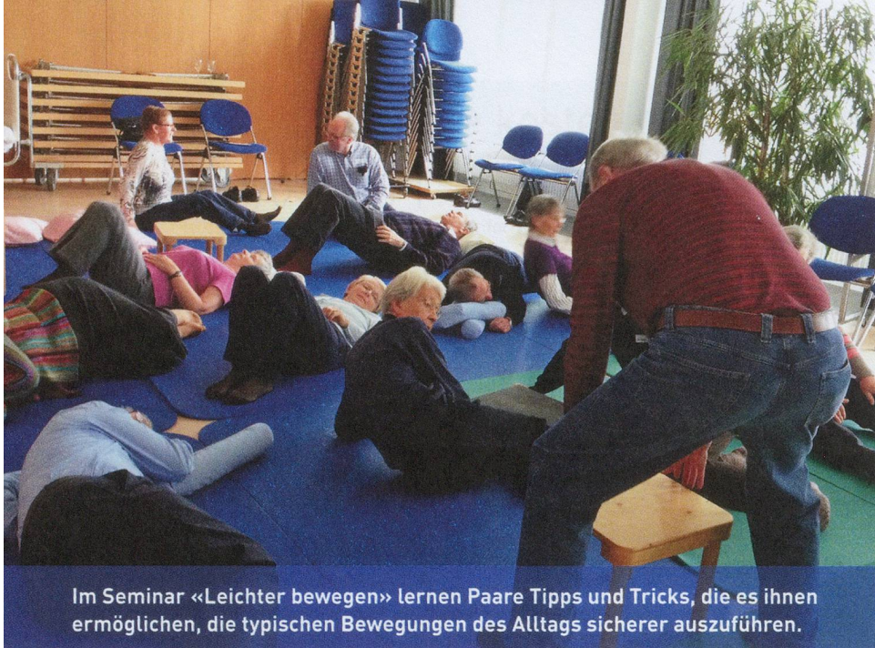
Im Seminar «Leichter bewegen» lernen Paare Tipps und Tricks, die es ihnen ermöglichen, die typischen Bewegungen des Alltags sicherer auszuführen.