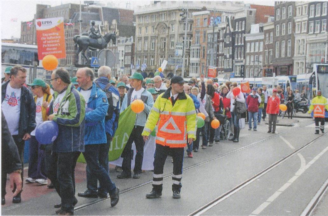
Plus de 1000 personnes de 25 nations ont traversé le cœur d'Amsterdam pour l'European Unity Walk.