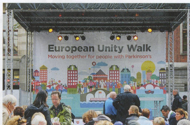
La mise en scène d'un programme composé d'exercices de mouvement, de musique, de danse et de discours.