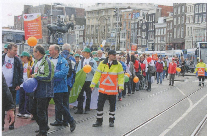
Plus de 1000 personnes de 25 nations ont traversé le cœur d'Amsterdam pour l'European Unity Walk.