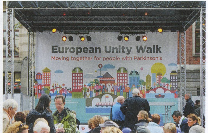
La mise en scène d'un programme composé d'exercices de mouvement, de musique, de danse et de discours.