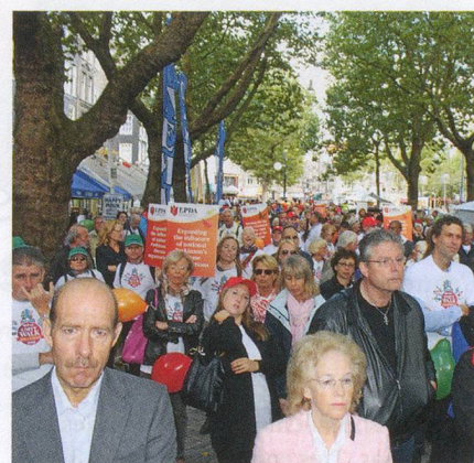
Solidarité : malades ou en bonne santé, unis par les mêmes valeurs.