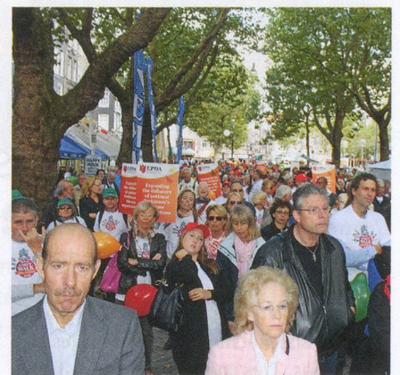
Solidarité : malades ou en bonne santé, unis par les mêmes valeurs.