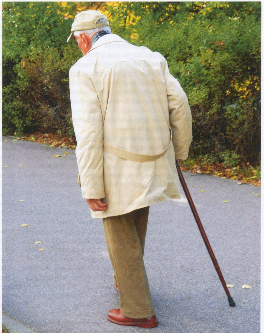
Paradoxyer Effekt: L-Dopa lässt manche Parkinsonpatienten Wurzeln schlagen.