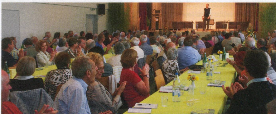
Elle aura également lieu en 2012 : la séance d'information romande à Tschugg.