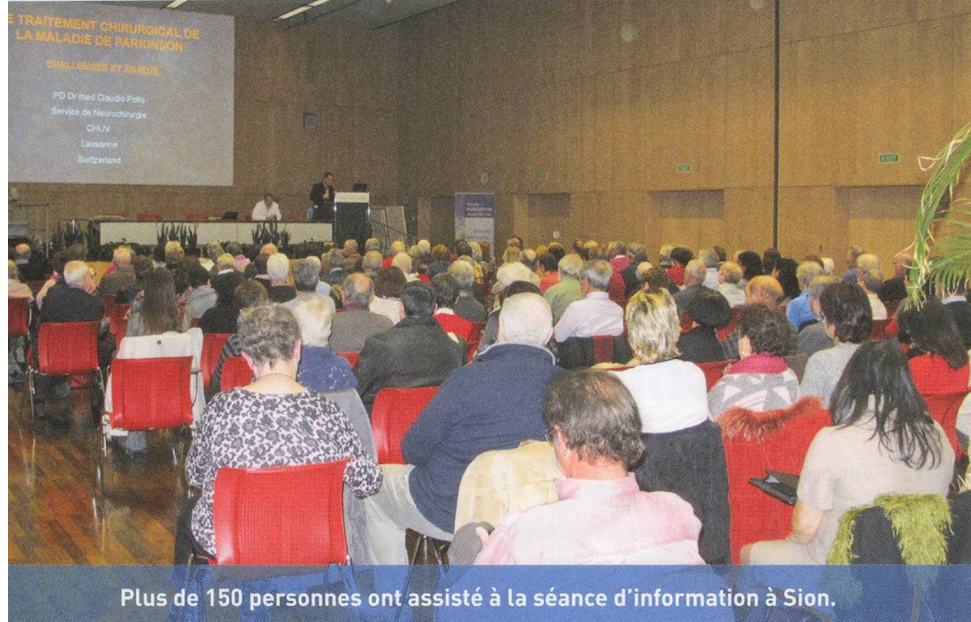
Plus de 150 personnes ont assisté à la séance d'information à Sion.