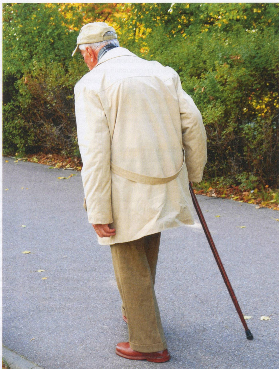
Effetto paradossale: a causa della L-dopa, certi pazienti «mettono radici».