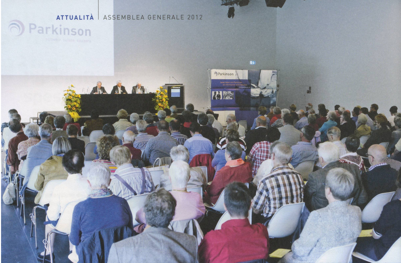
Una sala ben riempita: 107 membri e 29 ospiti si sono recati a Lucerna per l'Assemblea generale 2012.