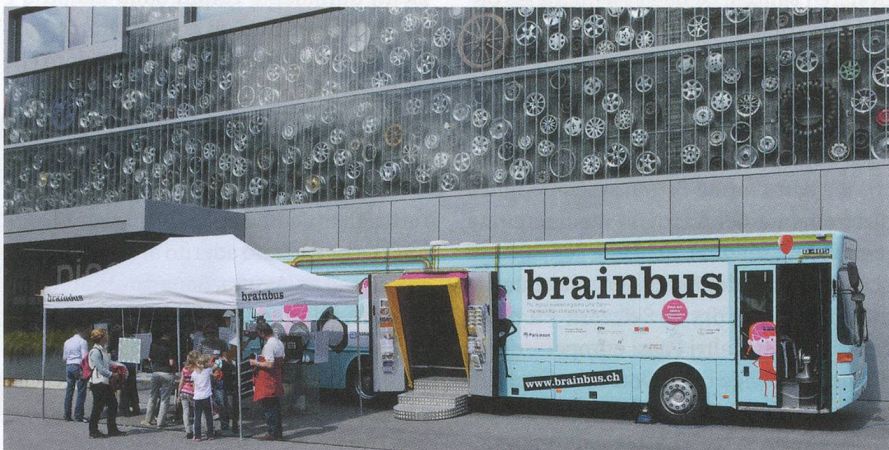
In occasione della 27ª Assemblea generale, il BrainBus – l'esposizione itinerante sul cervello umano – ha fatto tappa proprio davanti al Museo dei trasporti.