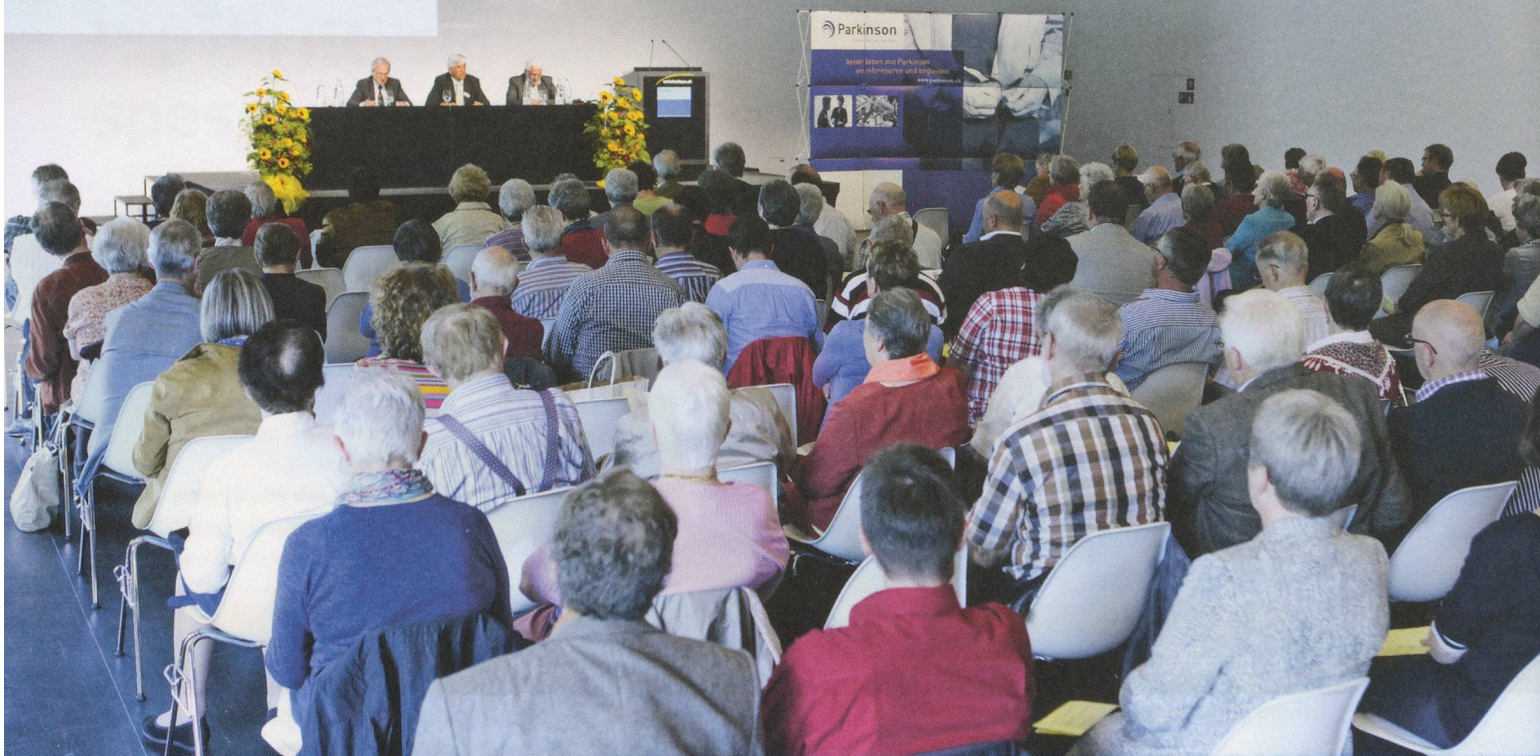
Una sala ben riempita: 107 membri e 29 ospiti si sono recati a Lucerna per l'Assemblea generale 2012.