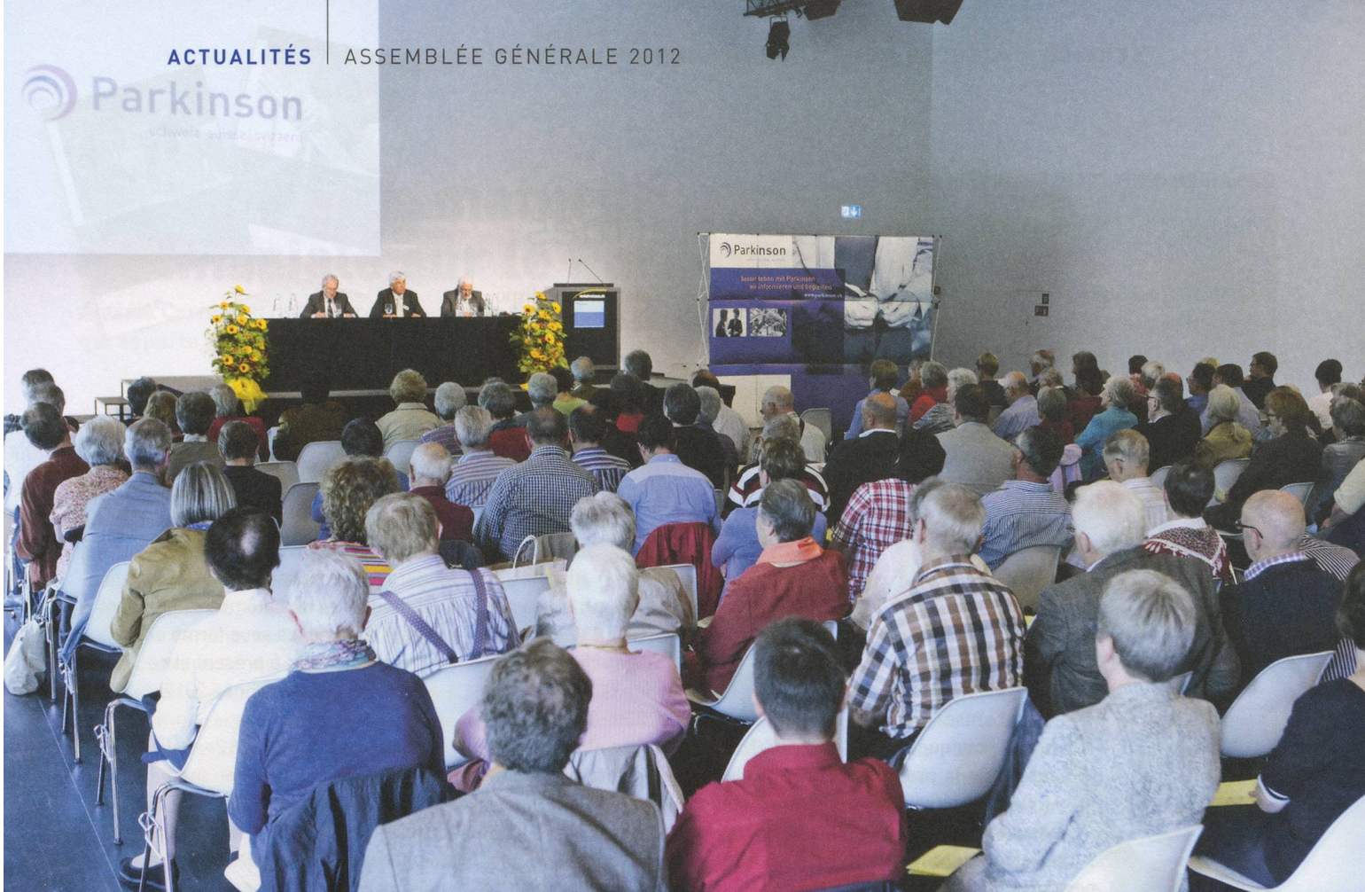
Une salle de réunion bien remplie : 107 membres et 29 invités se sont rendus à Lucerne pour assister à l'assemblée générale.