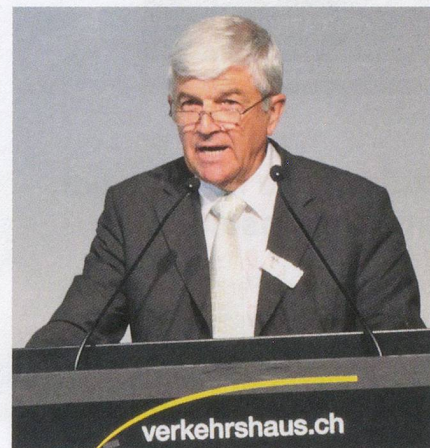
Le président Markus Rusch a rondement et promptement mené l'assemblée.