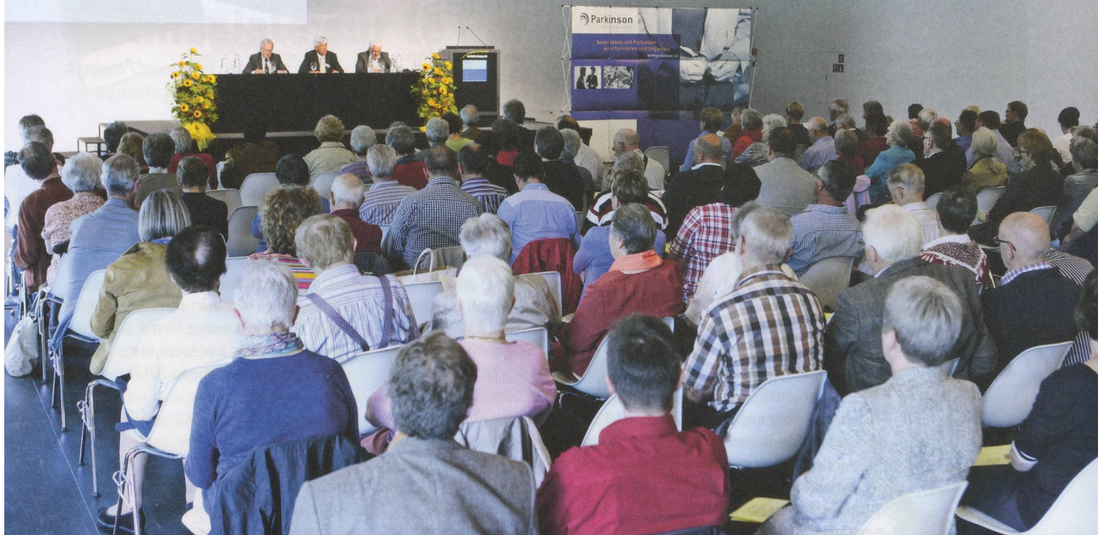
Une salle de réunion bien remplie : 107 membres et 29 invités se sont rendus à Lucerne pour assister à l'assemblée générale.