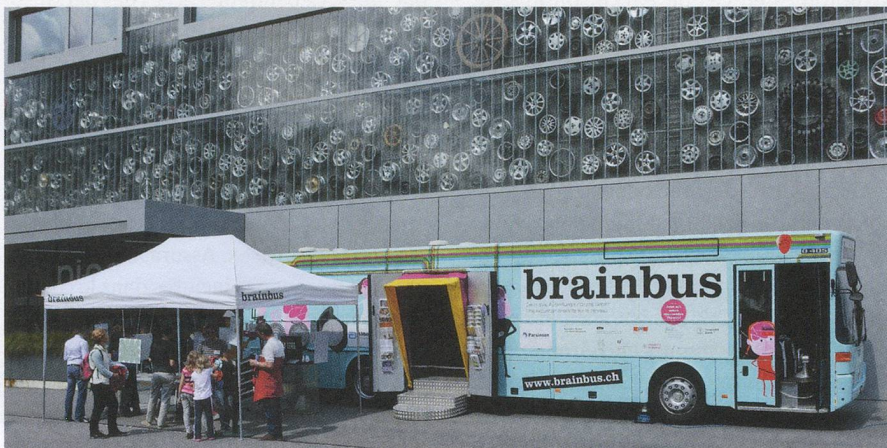
À l'occasion de la 27 e assemblée générale, l'exposition itinérante sur le cerveau humain BrainBus a fait halte juste devant le Musée des Transports.