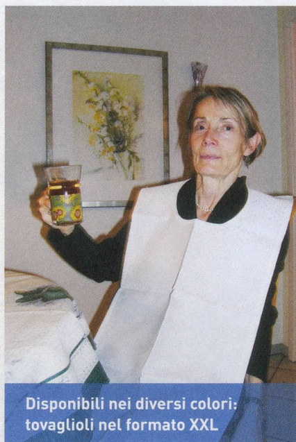
Disponibili nei diversi colori: tovaglioli nel formato XXL

Da CHF 30.– al pezzo, più CHF 4.– per le spese di spedizione; Rita Ryffel, Stettbachstr. 40, 8600 Dübendorf, tel. 044 822 17 90, e-mail: r.ryffel@glattnet.ch