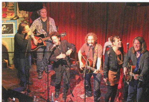
Zum Finale sangen alle sechs Künstler gemeinsam.