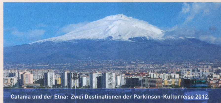
Catania und der Etna: Zwei Destinationen der Parkinson-Kulturreise 2012.