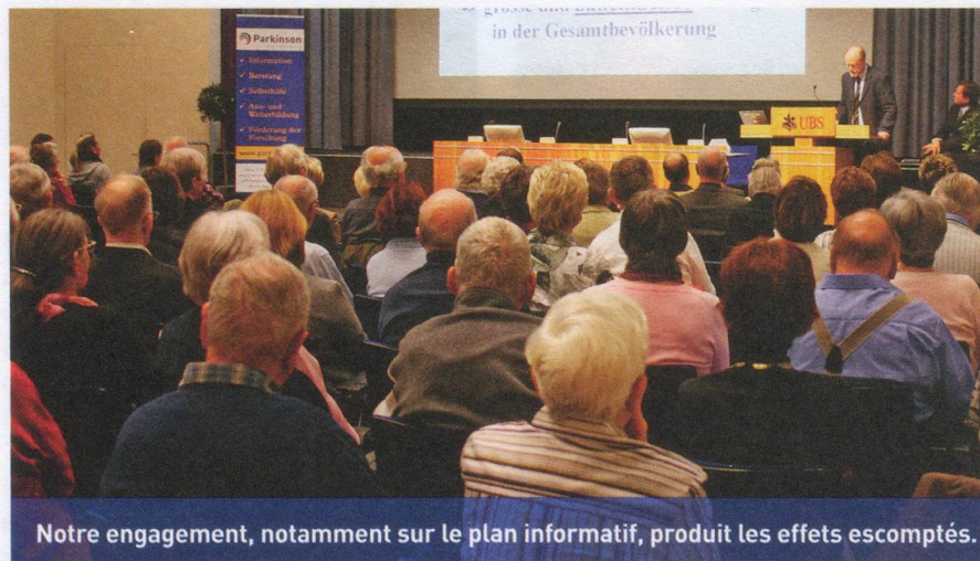
Notre engagement, notamment sur le plan informatif, produit les effets escomptés.

Une chose est sûre : nous nous réjouissons que notre travail porte ses fruits et ferons tout notre possible pour nous améliorer davantage encore. jro