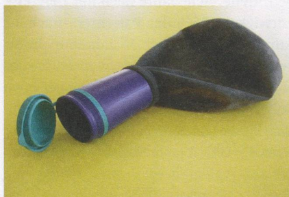
Uribag «Herren»: Robust und praktisch.