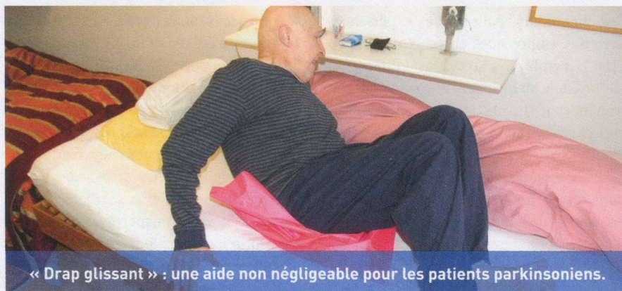
« Drap glissant » : une aide non négligeable pour les patients parkinsoniens.

Disponible auprès de Parkinson Suisse, Gewerbestrasse 12a, 8132 Egg, tél. 043 277 20 77, fax: 043 277 20 78, courriel: info@parkinson.ch, Prix pour membre CHF 19,50 Prix pour non-membre CHF 23,50