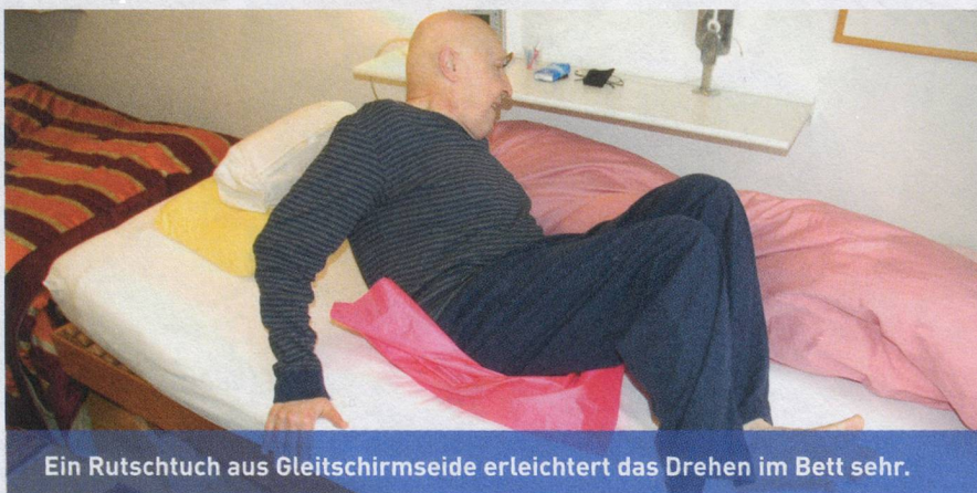
Ein Rutschtuch aus Gleitschirmseide erleichtert das Drehen im Bett sehr.

Preis: CHF 19.50 für Mitglieder, CHF 23.50 für Nicht-Mitglieder