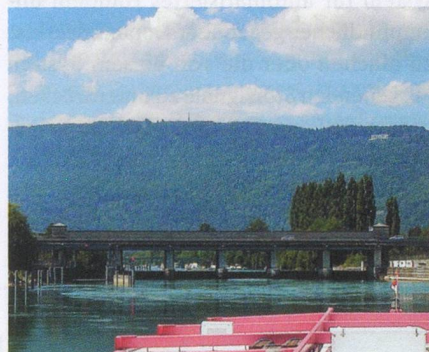
SHG Langnau: Auf der Aare von Altreu nach Biel gereist und dabei auch die Schiffschleuse in Port überwunden.