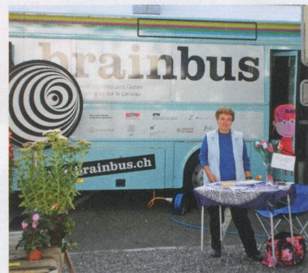
SHG Frauenfeld: Im September 2010 warb die SHG mit einem Informationstisch beim BrainBus für ihre Arbeit.