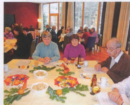
SHG Chur: 38 Mitglieder kamen zur Weihnachtsfeier 2010, an der zehn Flötistinnen für Unterhaltung sorgten.

Mit der SHG JUPP Dialog Zürich gibt es seit Kurzem eine dritte SHG für Jungbetroffene im Kanton Zürich. Der Schwerpunkt der neuen SHG, die sich jeweils am zweiten Mittwoch im Monat am frühen Abend trifft, ist der Erfahrungsaustausch, es werden aber auch Ausflüge und andere Aktivitäten angeboten. Weitere Informationen gibt es im Internet auf www.juppdialog.ch oder bei Dani Kühler, E-Mail: info@juppdialog.ch , Tel. 076 412 00 99. jro