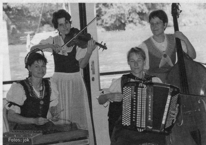
Les dames du «Appenzeller Frauenstriichmusig» ont joué avec beaucoup de talent et de charme pendant le tour en bateau.

C'est dans une ambiance détendue que les invités ont pris le chemin du retour. Ils étaient nombreux à venir de loin: du Tessin, de la Romandie et de la Suisse orientale. De nombreux participants ont envoyé une lettre de remerciements au secrétariat central. Un membre de longue date a écrit: «Ce fut une belle et digne fête. Merci!». jok