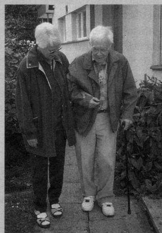
Una passeggiata serale concilia il sonno