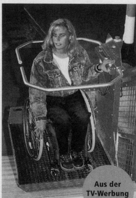
Aus der TV-Werbung