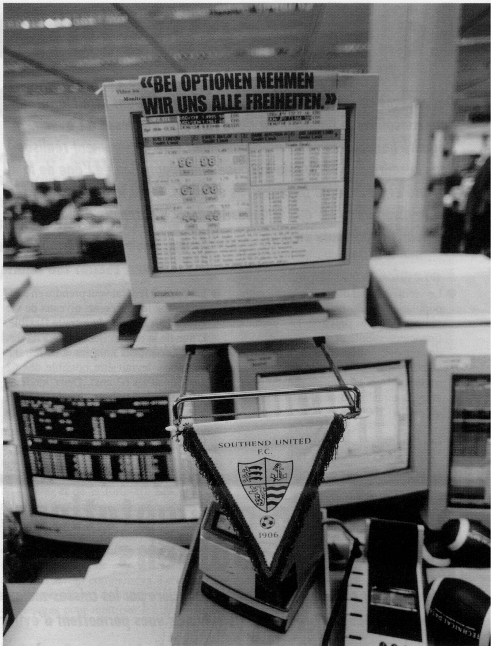
Im Backoffice: Die Freiheit beziehungsweise die Freizeit des Anlageberaters