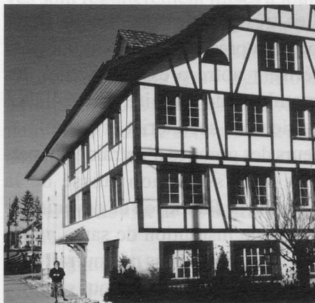
Le siège du secrétariat central à Hinteregg

geant plus particulièrement d'organiser les journées d'information et de rechercher les conférenciers. Nous pensons notamment que la présence des malades et de leurs familles à ces journées est indispensable, afin qu'ils puissent témoigner et faire part de leurs souhaits.