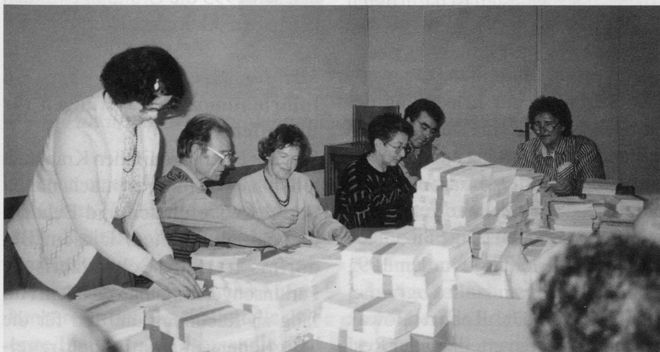
Die Zürcher-Gruppe beim Verpacken des Mitteilungsblattes