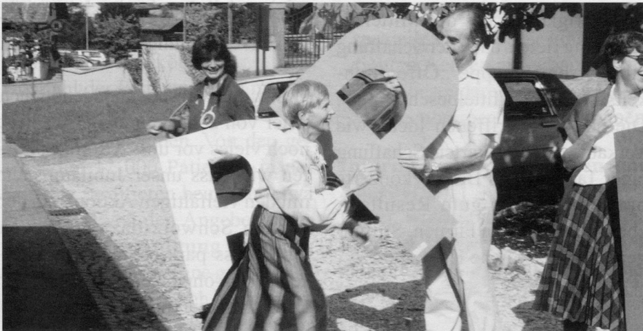
P wie Parkinson: Weiterbildungstagung 1994 in Wislikofen

Infirmis eine schriftliche Vereinbarung für die Beratung von Patienten getroffen, die 1994 durch einen neuen Vertrag ersetzt wurde. Die Vereinigung ist auch Mitglied der Schweizerischen Gesundheitsligenkonferenz GELIKO, der Schweizerischen Arbeitsgemeinschaft für die Eingliederung Behinderter SAEB, der Schweizerischen Arbeitsgemeinschaft Hilfsmittelberatung SAHB, der Schweizerischen Arbeitsgemein-