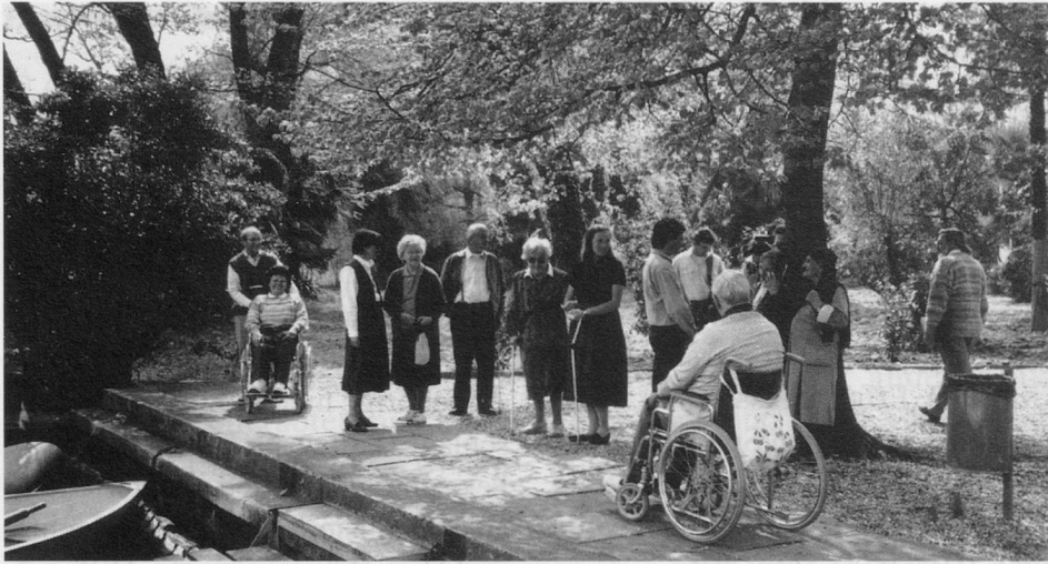
Ferienlager in Magliaso

schaft für Rehabilitation SAR sowie der Zentralkunftsstelle für Wohlfahrtsunternehmungen ZEWO. Sie versucht zudem immer wieder, mit anderen sozialen Institutionen gemeinsame Aktionen zu planen oder Dienstleistungen gemeinsam zu nutzen (z.B. Ferienangebote zusammen mit der Rheumaliga, MS-Gesellschaft usw.).