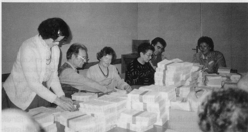
Die Zürcher-Gruppe beim Verpacken des Mitteilungsblattes