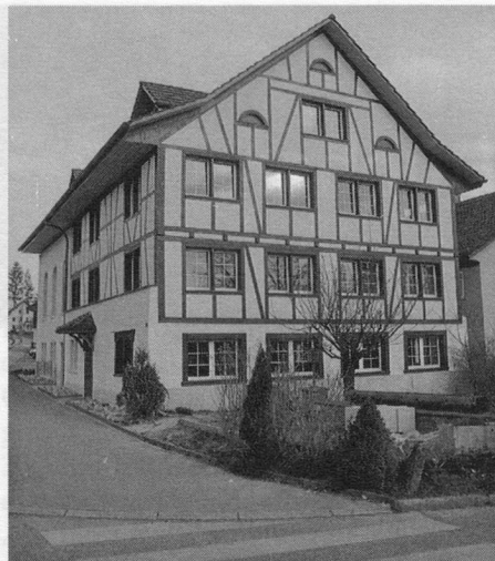
Das schicke Haus an der Forchstrasse 182 in Hintereggen...