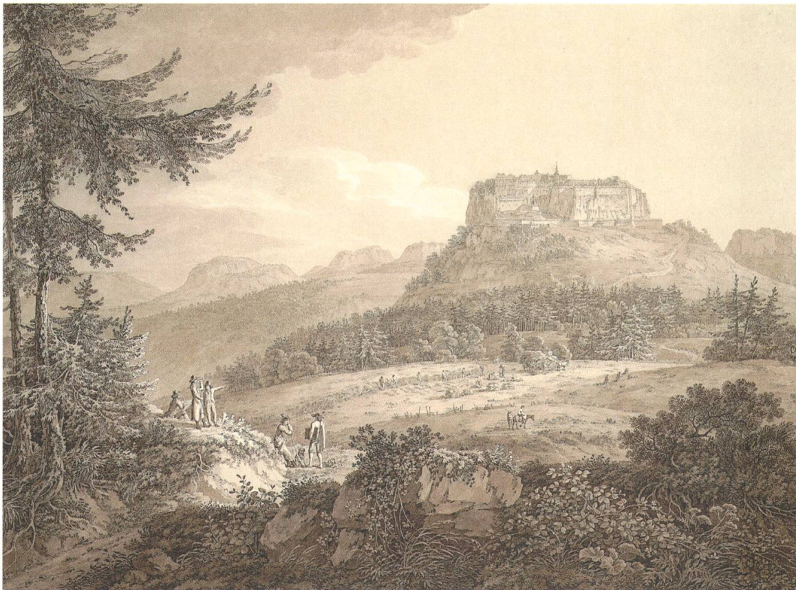
Adrian Zingg, Festung Königstein , Feder in Schwarz und Braun, Pinsel in Braun, 48,2 × 65,5 cm, Albertina, Wien, Inv.-Nr. 14990