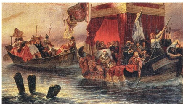
4 Paul Delaroche, La barque du cardinal Richelieu sur le Rhône , 1829, huile sur toile, 57,2 x 97,3 cm, Wallace Collection, Londres