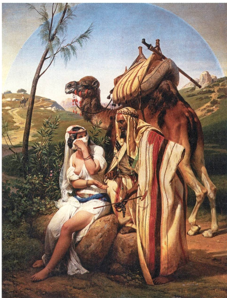
7 Horace Vernet, Judas et Thamar , 1840, huile sur toile, 129 × 97,5 cm, Wallace Collection, Londres

de l'œuvre ne manque pas d'inquiéter le collectionneur en raison de l'augmentation du prix de ses œuvres, le peintre étant entre-temps devenu l'un des artistes les plus célèbres de France. L'amateur fait part de ses inquiétudes à son frère: «Je suis depuis quelques temps fort préoccupé d'une position difficile dans laquelle je me trouve vis-à-vis des Vernet & Delaroche mes amis. Il y a 10 ou 15 ans que j'étais convenu avec H[orace] Vernet qu'il me ferait un tableau, mais presque toujours occupé par le Gouvernement, il renvoyait d'une année à une autre; ce tableau devait alors coûter 5 ou 6 mille francs. Enfin à son retour de Syrie & en quarantaine il a commencé un tableau, une scène Biblique, & il m'a annoncé qu'il espérait qu'il me plairait, car il me donnerait la préférence sur tout autre acquéreur, & il y a travaillé avec ardeur dans cette intention. Tout cela est au mieux; mais la réputation de Vernet s'est tellement accrue & ses tableaux sont si recher-