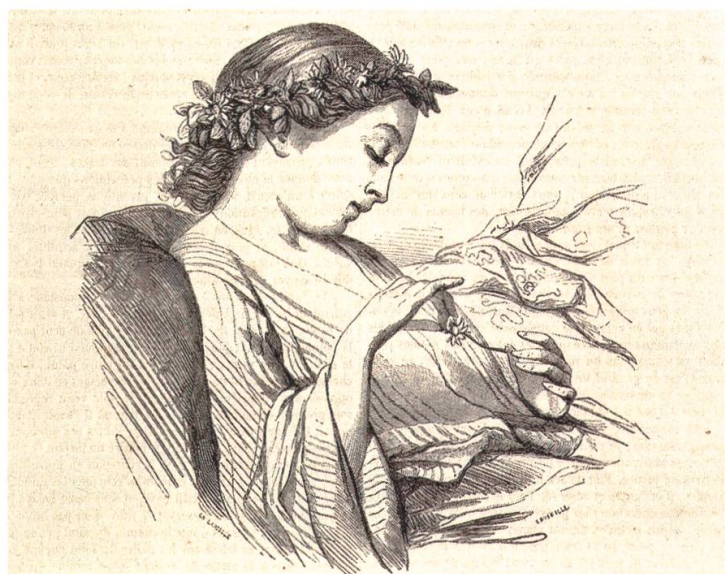
6 D'après un dessin de Charles Landelle, Jeune fille interrogeant une marguerite , reproduction gravée illustrant «Le magasin pittoresque», 1847, p. 141

sède en effet un ensemble de six œuvres de Delaroche – dont son propre portrait (1846, Paris, Musée du Louvre, fig. 1) –, nombre record de tableaux pour un seul artiste au sein de la galerie.