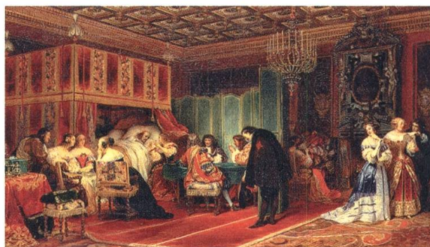
5 Paul Delaroche, La dernière maladie du cardinal Mazarin , 1830, huile sur toile, 56,4 x 97,5 cm, Wallace Collection, Londres

Ingres, demeuré propriétaire de l'œuvre, l'expose au Salon de 1819, où Pourtalès l'acquiert 12 . A cette date, Ingres n'est pourtant pas encore le maître de l'école française de peinture, l'héritier direct de David comme il le sera suite au Salon de 1824 où Le vœu de Louis XIII (Montauban, cathédrale) remporte un grand succès. A cette période, le peintre, lauréat du Grand Prix de l'Académie des beaux-arts (1801), s'est volontairement exilé à Rome et sa carrière peine à décoller à Paris. L'intérêt que Pourtalès porte à Ingres semble essentiellement tenir à des questions de prestige social. En effet, le collectionneur ne tient pas particulièrement en grande estime le tableau d'Ingres 13 puisqu'il n'hésite pas à s'en séparer en 1854, lorsque le marchand Georges Goupil le lui achète pour la somme de 26'000 francs, soit plus de vingt fois le montant initialement dépensé. Les acquisitions de Pourtalès prennent ici une nouvelle dimension, celle d'investissement, qui n'est certes pas étrangère au Neuchâtelois au vu de ses origines marchandes.