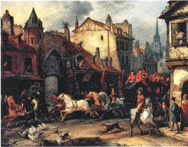
9 Carle Vernet, Die Rückkehr von der Jagd , 1828, Öl auf Leinwand, 111 x 145 cm, Bayerische Staatsgemäldesammlungen, Neue Pinakothek, München