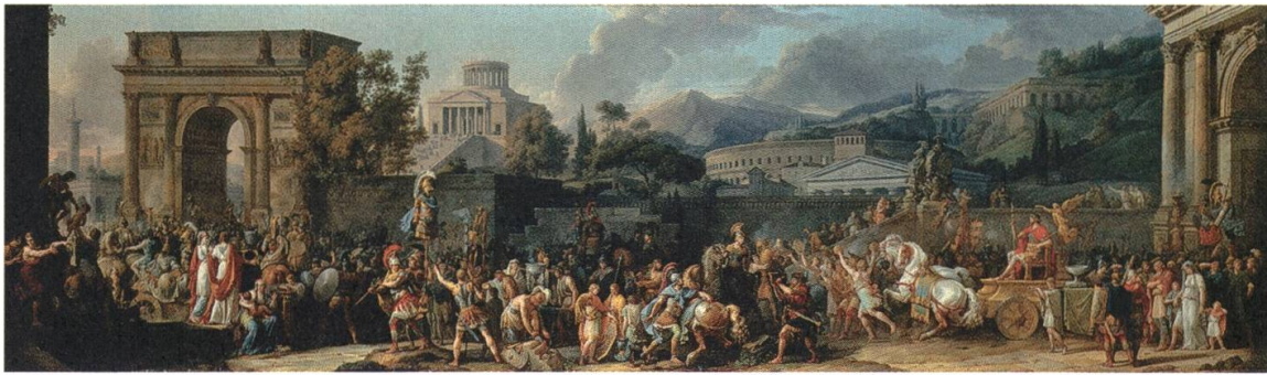
1 Carle Vernet, Der Triumphzug des Aemilius Paulus , 1788/1789, Öl auf Leinwand, 129,9 × 438,2 cm, The Metropolitan Museum of Art, New York

Voraussetzung für die Aufnahme des jungen Künstlers als «agrée» war die Präsentation eines Aufnahmestückes, das als Historiengemälde die Eignung für die anvisierte Hierarchieposition unter Beweis stellen sollte. Vernets erstes und – wie sich erweisen sollte – auch sein einziges Historienbild, der anschliessend im Salon des Jahres 1789 ausstellte Triumphzug des Aemilius Paulus (Abb. 1), beruht auf einer von Plutarch geschilderten Episode aus der Geschichte der Römischen Republik, wonach der geehrte Feldherr, der den Makedonenkönig Perseus in der Schlacht bei Pydna besiegt hatte, durch Neid und Missgunst in den eigenen Reihen beinahe um seine verdiente Anerkennung geprellt worden wäre. Das Gemälde orientierte sich am Vorbild Jacques-Louis Davids (1748–1825) als der inzwischen fast unbestrittenen Führungsgestalt der französischen Historienmalerei. Statt jedoch die provokativen Stilbrüche des bis heute berühmtesten Werkes von David, des Schwurs der Horatier von 1785, zum Ausgangspunkt des eigenen Entwurfes zu machen, griff Vernet auf eine frühere, weniger kontroverse Etappe im Werk des Künstlerkollegen zurück. 7 Wie David in seinem Gemälde Belisarius empfängt ein Almosen (Abb. 2) aus dem Salon des Jahres 1781 bemühte sich Vernet in seiner Darstellung um eine von Poussin entlehnte, friesartige Komposition der Figuren in einem bühnenhaft schmalen Bildraum, der durch eine bildparallel geführte Stadtmauer scharf von der antiken Architektur-