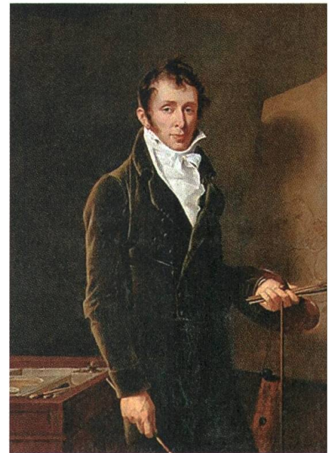
7 Robert Lefèvre, Porträt von Carle Vernet , 1804, Öl auf Leinwand, 129,5 × 97,5 cm, Musée du Louvre, Paris