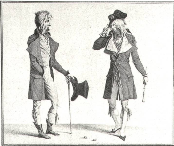
8 Jean-Louis Darcis nach Carle Vernet, Les incroyables , 1797, Kupferstich, 27,6 × 33,1 cm, Bibliothèque Nationale de France, Département des Estampes, Paris

Idealfigur des Hofmannes der Renaissance verkörperten aristokratischen Verhaltenskodexes für neue gesellschaftliche Distinktionsmechanismen bildet das Stereotyp des Dandy die Grundlage für die bis in die Gegenwart hochgehaltene Verhaltensnorm der «coolness». Diesen historisch aufeinanderfolgenden Demonstrationen einer maskulinen Elitezugehörigkeit ist die scharfe Abgrenzung von der Masse der Unberufenen gemeinsam, die bei Vernet etwa in der Vorliebe für ironische Stutzerkarikaturen zum Ausdruck kommt, mit denen er schon während des Direktoriums auf dem Grafikmarkt präsent war. Seit 1797 publizierte der Kupferstecher Jean-Louis Darcis solche Per-