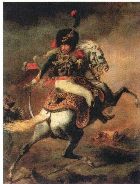
10 Théodore Géricault, Offizier der Gardejäger beim Angriff , 1812, Öl auf Leinwand, 349 x 266 cm, Musée du Louvre, Paris

die dem Tier eine individuelle Persönlichkeit zuschrieb. Mit dieser latenten Anthropomorphisierung des Pferdes gewinnen die an sich banalen Genremotive eine emotionale Spannung, wie sie früher nur von der Historienmalerei erwartet worden wäre. Der grösste Achtungserfolg des Künstlers in seinen späteren Jahren, das im Salon des Jahres 1831 ausgestellte Gemälde einer Rückkehr von der Jagd (Abb. 9), kann diese Qualität veranschaulichen. 27 1828 im Auftrag des Bankiers und Kunstsammlers Georges Schickler entstanden, zeigt es eine grossbürgerliche Jagdgesellschaft in englischem Kostüm, die eine verschlafene Kleinstadt in Aufruhr versetzt, indem sie ihren Mehrspanner mit voller Geschwindigkeit durch den Ort treibt. Die affektgesteuerten Reaktionen von Mensch und Tier kontrastieren mit der entspannten Gleichgültigkeit der Jäger, die von der Aufregung um sie herum nicht berührt zu sein scheinen. Dieser Gegensatz wird in der Figur eines Offiziers auf einem Schimmel im Vordergrund, der der wilden Jagdpartie ausweichen muss, noch einmal akzentuiert, denn trotz dem Durcheinander gelingt es diesem Reiter, das scheuende Tier unter Kontrolle zu halten. Mit seiner ausdrucksstarken Physiognomie blickt es beinahe frontal auf den Betrachter, während der Offizier sich zu dem Geschehen umwendet. Von hier aus ist es nur noch ein kleiner Schritt zu