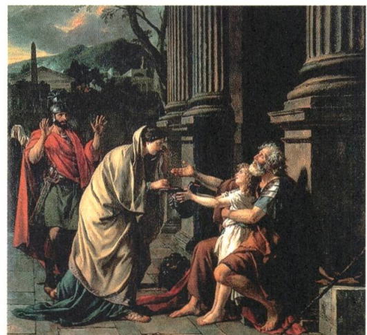
2 Jacques-Louis David, Belisarius empfängt ein Almosen , 1781, Öl auf Leinwand, 288 × 312 cm, Musée des Beaux-Arts, Lille

Voraussetzung für die Aufnahme des jungen Künstlers als «agrée» war die Präsentation eines Aufnahmestückes, das als Historiengemälde die Eignung für die anvisierte Hierarchieposition unter Beweis stellen sollte. Vernets erstes und – wie sich erweisen sollte – auch sein einziges Historienbild, der anschliessend im Salon des Jahres 1789 ausstellte Triumphzug des Aemilius Paulus (Abb. 1), beruht auf einer von Plutarch geschilderten Episode aus der Geschichte der Römischen Republik, wonach der geehrte Feldherr, der den Makedonenkönig Perseus in der Schlacht bei Pydna besiegt hatte, durch Neid und Missgunst in den eigenen Reihen beinahe um seine verdiente Anerkennung geprellt worden wäre. Das Gemälde orientierte sich am Vorbild Jacques-Louis Davids (1748–1825) als der inzwischen fast unbestrittenen Führungsgestalt der französischen Historienmalerei. Statt jedoch die provokativen Stilbrüche des bis heute berühmtesten Werkes von David, des Schwurs der Horatier von 1785, zum Ausgangspunkt des eigenen Entwurfes zu machen, griff Vernet auf eine frühere, weniger kontroverse Etappe im Werk des Künstlerkollegen zurück. 7 Wie David in seinem Gemälde Belisarius empfängt ein Almosen (Abb. 2) aus dem Salon des Jahres 1781 bemühte sich Vernet in seiner Darstellung um eine von Poussin entlehnte, friesartige Komposition der Figuren in einem bühnenhaft schmalen Bildraum, der durch eine bildparallel geführte Stadtmauer scharf von der antiken Architektur-