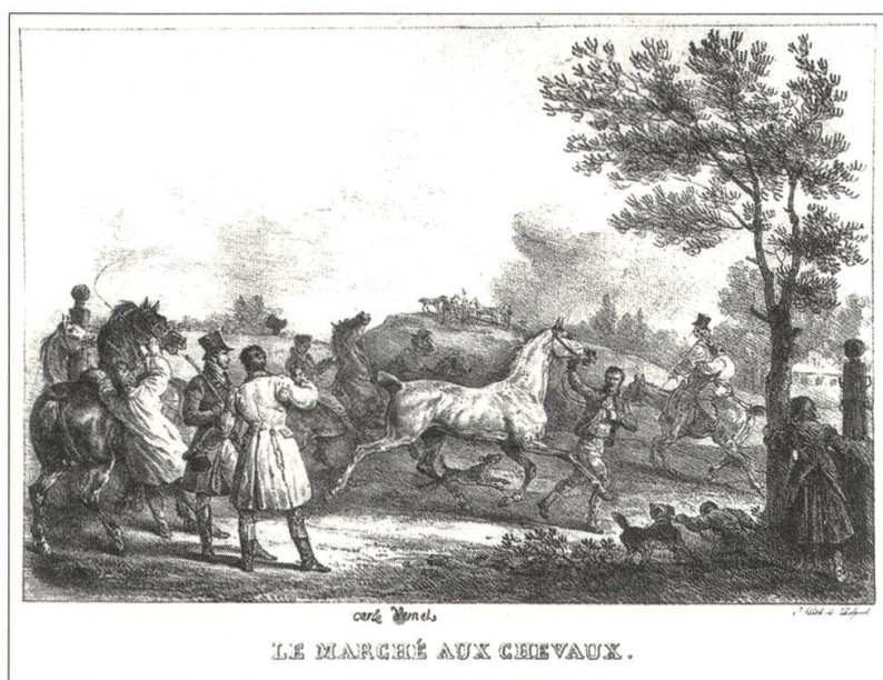
5 Carle Vernet, Pferdemarkt auf einer Dorfweide , 1821, Lithografie, ca. 35 × 23 cm, Bibliothèque Nationale de France, Département des Estampes, Paris

aufbäumenden Tieres und seiner Beherrschung durch den Menschen gleich in mehreren Varianten. Mit der Landschaftskulisse und den Repoussoirfiguren der Dorfkinder bietet sich eine solche Bilderfindung leicht dazu an, eine Erzählung von der Art zu imaginieren, wie sie sich in den Gesellschaftsbeobachtungen der Romane Balzacs findet. Mit den typischen Protagonisten Balzacs, jungen Männern am Beginn ihres gesellschaftlichen Aufstiegs in die grossstädtische Oberschicht, korrespondieren auch die beiden Gestalten der Käufer am vorderen linken Bildrand, die wie romantische Identifikationsfiguren nur in der Rückenansicht bzw. im verlorenen Profil zu sehen sind und damit eine Stellvertreterrolle für den Betrachter annehmen. Sie verweisen auf den semantischen Bezugspunkt sämtlicher Pferdomotive Vernets, die Kultfigur des Dandy als ideale Verkörperung der neuen urbanen Oberschicht des nachrevolutionären Frankreich.