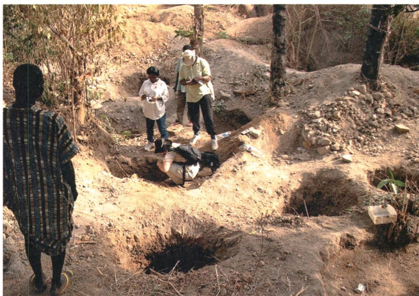
2 Près de Nok (Nigeria), les archéologues découvrent la destruction d'un site archéologique par les villageois à la recherche de statuettes en terre cuite, 2009

lectionneur pour plus de 100 000 francs, qui enfin le liquidera en vente publique, une fois valorisé par des expositions et des publications luxueuses, pour 1 000 000 de francs. Les sommes en jeu autorisent toutes les stratégies de corruption ou de substitution d'œuvres. La démarche est bien connue: sortie illégale de l'objet du pays, établissement d'un «pedigree» (pseudo-autorisation d'exportation, inventaire de succession, certificat de vente, etc.) et blanchiment dans un pays laxiste, par une exposition et un catalogue, si possible cautionné par un professionnel, avant la mise en vente.