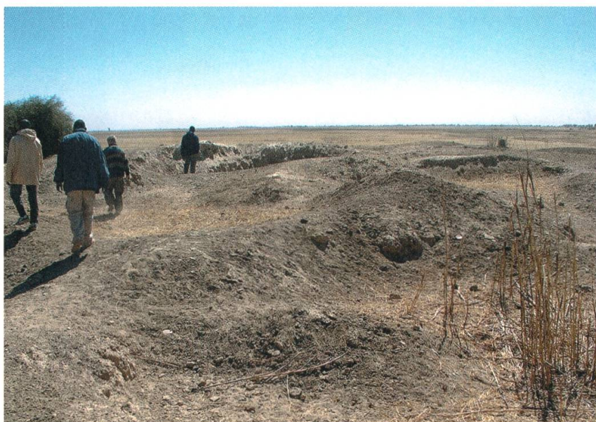
1 Sur les rives du Niger (Mali), site d'habitat détruit par les pillleurs à la recherche d'objets archéologiques, 2008