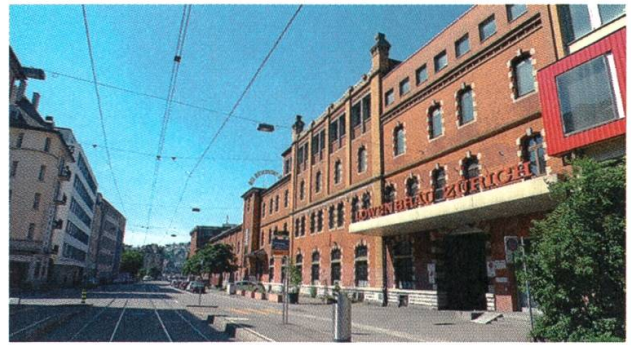
3 Löwenbräu-Areal, Kreis 5, Zürich

zusammen. In Europa bietet sich das institutionelle Gefüge wesentlich stärker als Alternative für eine berufliche Laufbahn an.