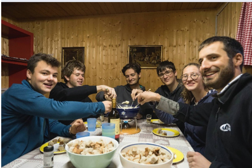
Käse en masse: Beim Wandern und abends ums Rechaud.

mel zu bedecken. Einige schöne Objekte, wie die Whirlpoolgalaxie M51 und den Saturn, sahen wir nichtsdestotrotz. Einzig Jupiter wollte sich nicht zeigen. Für die nächste Nacht sah bereits die Prognose sehr gut aus – keine einzige Wolke sollte die Sicht verschleiern. Und so war es auch! Ein unvergessliches Erlebnis! Zahlreiche hinreissend schöne Objekte konnten gesichtet werden. Wir sahen wieder den Saturn und endlich den Jupiter. Nun machten wir uns ans Werk: Wir beobachteten zahlreiche Kugelsternhaufen, Nebel und Galaxien. Von der Ribihütte aus lässt sich auch der Schütze bestens beobachten. So verbrachten wir fast die ganze Nacht mit dieser astronomischen «Schatzkiste». Wie nur selten konnten wir die Himmelskörper im Skorpion betrachten. Nur Neptun und Ura-