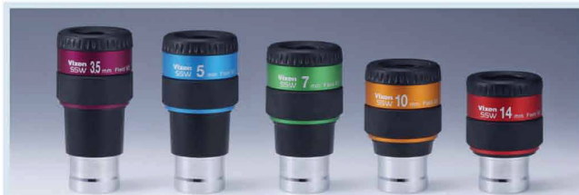
NEU: Vixen Okulare SSW 83° Ø 1 ¼", 31.7mm

Bildschärfe: Extrem scharfe Sternabbildungen über das gesamte Gesichtsfeld.