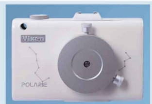
Vixen Polarie Star Tracker

Das Glas wurde für die Beobachtung von Sternfeldern konzipiert. Die geringe Vergrößerung von 2.1x ermöglicht u. a. eindrucksvolle Beobachtung der Milchstrasse. Bis 4x mehr Sterne als von blossen Auge!