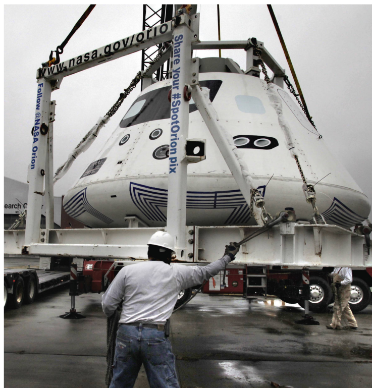
Abbildung 1: Orion-Raumschiff der NASA – hier eine Testversion – beim Verladen im Dezember 2013. Die Kapsel wurde auf eine Überführung vom Langley Research Center der NASA in Hampton, Virginia, zur Marinebasis San Diego in Kalifornien vorbereitet.

Für Anwendungen im Bereich der künstlichen Intelligenz verarbeiten hierzulande diverse Firmen riesige Datenmengen aus dem Weltall. So zum Beispiel