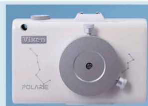
Vixen Polarie Star Tracker

Das Glas wurde für die Beobachtung von Stern- feldern konzipiert. Die geringe Vergrößerung von 2.1x ermöglicht u. a. eindrucksvolle Beobachtung der Milchstrasse. Bis 4x mehr Sterne als von blossem Auge!