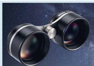
Vixen SG 2.1X42 Ultra-Weitwinkel Fernglas für Himmelsbeobachtung

*«High Transmission Multi-Coating»-Vergütung: Weniger als 0,5% über den Lichtbereich von 430nm bis 690nm.