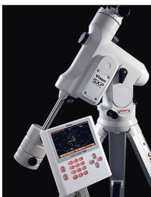
Parallaktische Montierung SXP mit Starbook TEN