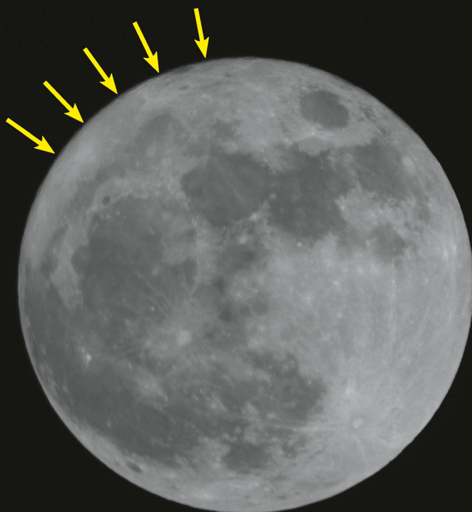
Abbildung 1: Der Vollmond am 19. März 2011 stand 5° südlich der Ekliptik, also fast in maximal möglicher Abweichung. Betrachtet man den Nordrand des Trabanten genau (siehe gelbe Pfeile), erkennt man tatsächlich noch minimale Schattenwürfe entlang des Terminators.

Pension Thomas Breu Fichtenweg 2 D-94256 Drachselsried 0049/9945/905283 www.pension-breue.de info@pension-breue.de