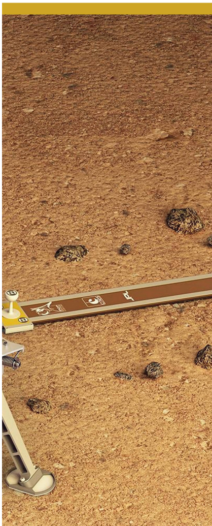
Abbildung 1: SEIS-Experiment zur Aufzeichnung von Marsbebenwellen.

SEIS erfasst auch das Hämmern der Wärmeflusssonde HP3 (ein weiteres InSight-Experiment) sowie vorbeiziehende Wirbelwinde (Staubteufel). Dies ermöglicht es, die physikalischen Eigenschaften der unmittelbar unter SEIS liegenden Bodenschichten