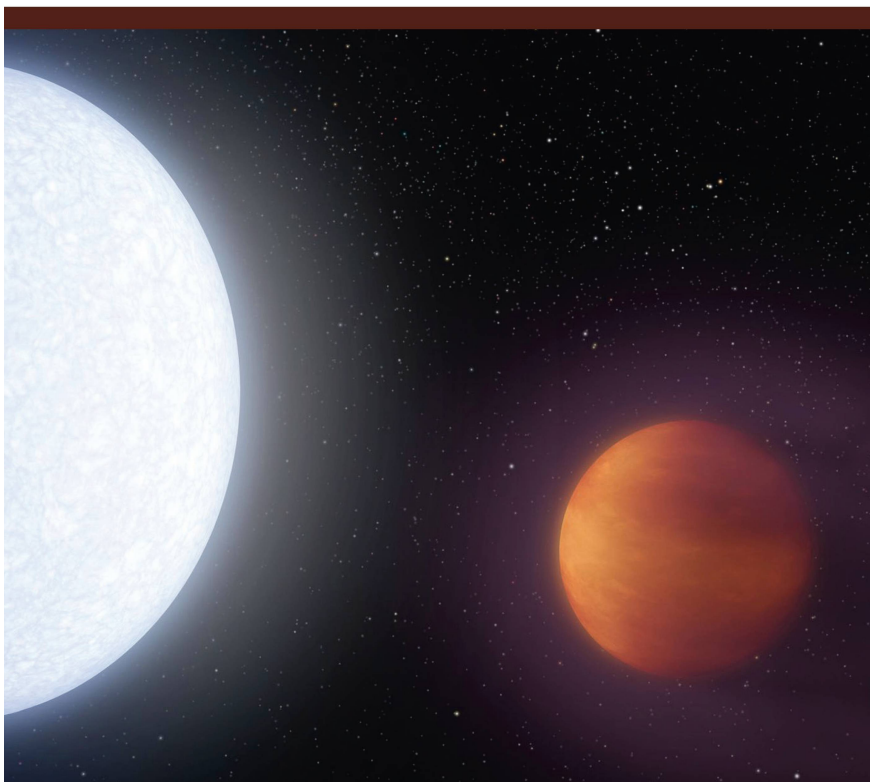
Abbildung 1: Künstlicher Ansicht von KELT-9b und seinem Zentralstern KELT-9.

Die Atome in der Atmosphäre des Exoplaneten absorbieren jeweils einen Teil des Lichts des Sterns. Jedes Atom hat so einen einzigartigen «Fingerabdruck» der Farben, die es absorbiert. Diese Fingerabdrücke können mit einem empfindlichen Spektrographen gemessen werden, der auf einem grossen Teleskop montiert ist. Daraus können Astronominnen und Astronomen die chemische Zusammensetzung der Atmosphäre von Exoplaneten ableiten, auch wenn sie viele Lichtjahre entfernt sind.