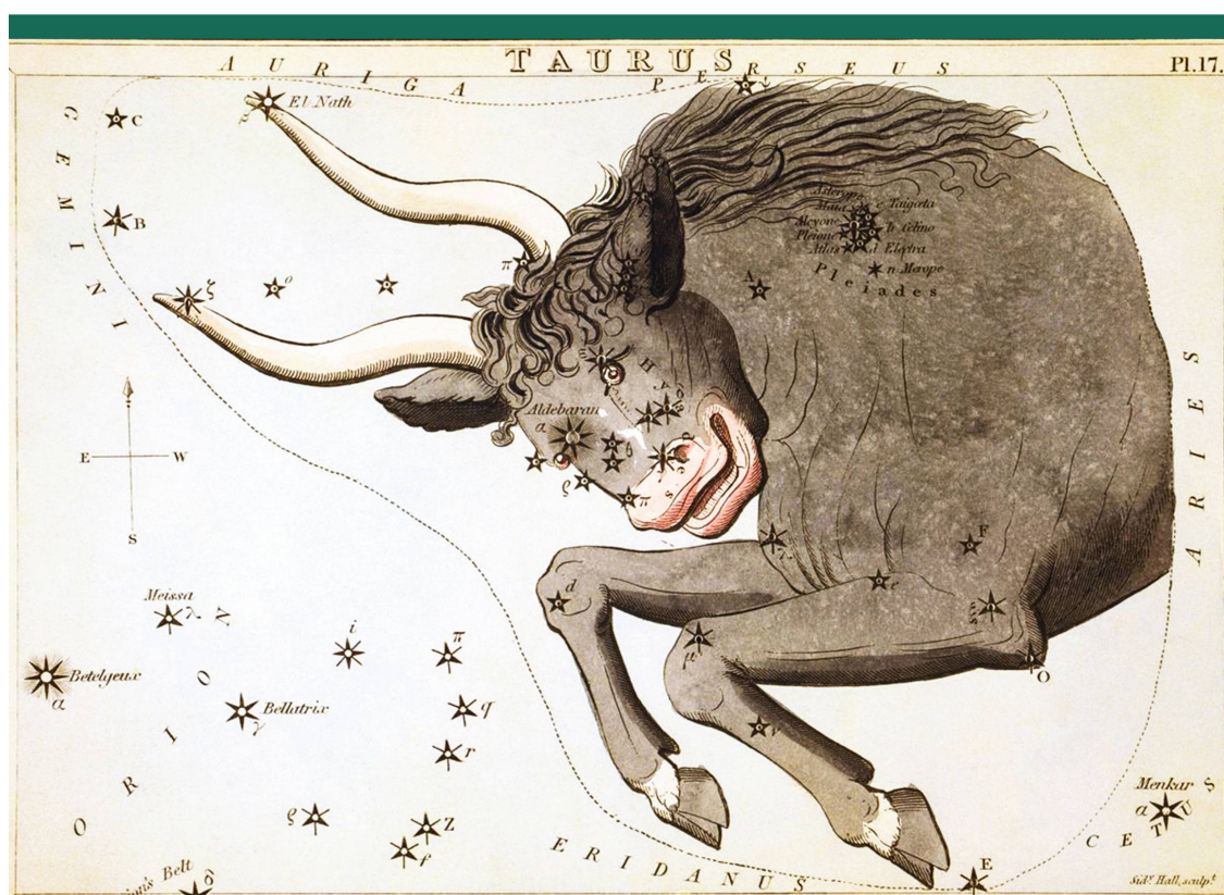
Abbildung 1: Sternbild Stier aus «Urania's Mirror» (1825) von Sidney Hall (1788 – 1831). Die Sammlungsbox enthielt 32 Sternbild-Karten. Sie waren bei den Sternen gelocht, sodass man sie vor eine Lichtquelle halten und das Sternen-Bild sehen konnte.

Die 1940 entdeckte Höhle von Lascaux in Südwest-Frankreich weist wundervolle jungsteinzeitliche Höhlenmalereien mit Tierdarstellungen auf. Heute zählt diese «Sixti-