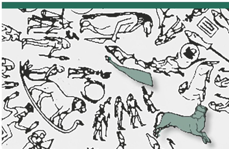
Abbildung 4: Darstellung von Stier und Stierschenkel auf dem runden Tierkreis von Dendera in Oberägypten (Zeichnung).

Im Jahr 1054 registrierten chinesische Astronomen im östlichen Bereich des Stierbilds eine Supernova; ihre Überreste sind im Krebs- oder Krabbennebel zu finden, den