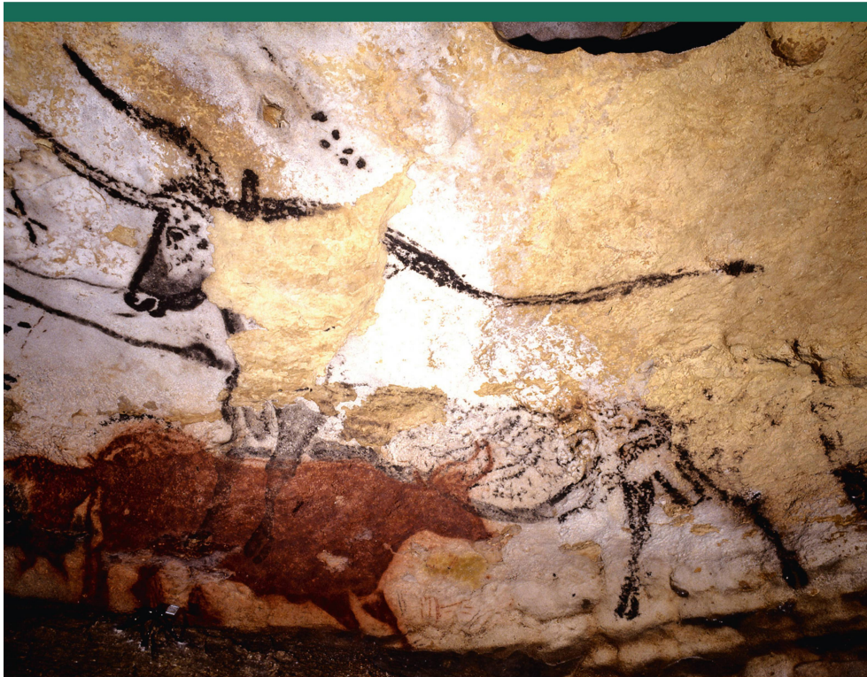
Abbildung 2: Darstellung des «4. Stiers» in der Höhle von Lascaux; er ist beinahe 6 m lang. Die sechs Punkte oberhalb der Stierschulter sind gemäss Michael Rappenglück die Plejadensterne.