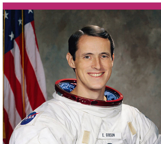
Abbildung 1: Astronaut Edward G. Gibson.

Am 15. November 2018 zeigte das Kino KOSMOS in Partnerschaft mit dem Swiss Space Museum den Dokumentarfilm «Searching for Skylab» in einer exklusiven Schweizer Vorpremiere anlässlich des Besuchs von Dwight Steven-Boniecki. Der Filmemacher war zu Gast im «Cosmic Talk» von Ben Moore. Während der Show wurde zudem der Skylab-Astronaut Ed Gibson (Bild) per Skype live zugeschaltet. ◀