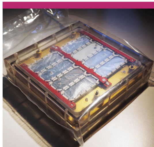
Abbildung 2: Die originalen Folien der Universität Bern, die auf der Raumstation Skylab waren, sind für die Auswertungen in kleine Metallrahmen gespannt worden. Sie sind nach wie vor in einen Plastikbeutel eingeschweisst, um eine Kontamination zu vermeiden.