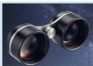
Vixen SG 2.1X42 Ultra-Weitwinkel Fernglas für Himmelsbeobachtung

*High Transmission Multi-Coating-Vergütung: Weniger als 0,5% über den Lichtbereich von 430nm bis 690nm.