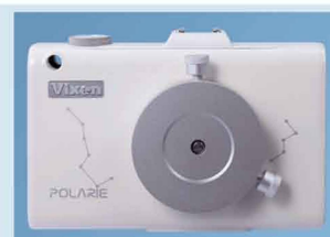
Vixen Polarie Star Tracker

Das Glas wurde für die Beobachtung von Sternfeldern konzipiert. Die geringe Vergrößerung von 2.1x ermöglicht u. a. eindrucksvolle Beobachtung der Milchstrasse. Bis 4x mehr Sterne als von blossem Auge!