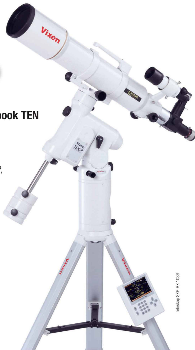
Teleskop SXP-AX 103S

VIXEN Fernrohr-Optiken: Achromatische Refraktoren – Apochromatische Refraktoren – Maksutov Cassegrain – Catadioptrische Systeme VISAC – Newton Reflektoren.