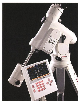
Parallaktische Montierung SXP mit Starbook TEN

VIXEN Fernrohr-Optiken: Achromatische Refraktoren – Apochromatische Refraktoren – Maksutov Cassegrain – Catadioptrische Systeme VISAC – Newton Reflektoren.