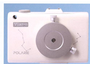
Vixen Polarie Star Tracker

Das Glas wurde für die Beobachtung von Sternfeldern konzipiert. Die geringe Vergrößerung von 2.1x ermöglicht u. a. eindrucksvolle Beobachtung der Milchstrasse. Bis 4x mehr Sterne als von blossem Auge!