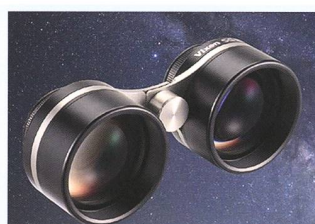
Vixen SG 2.1X42 Ultra-Weitwinkel Fernglas für Himmelsbeobachtung

*«High Transmission Multi-Coating»-Vergütung: Weniger als 0,5% über den Lichtbereich von 430nm bis 690nm.