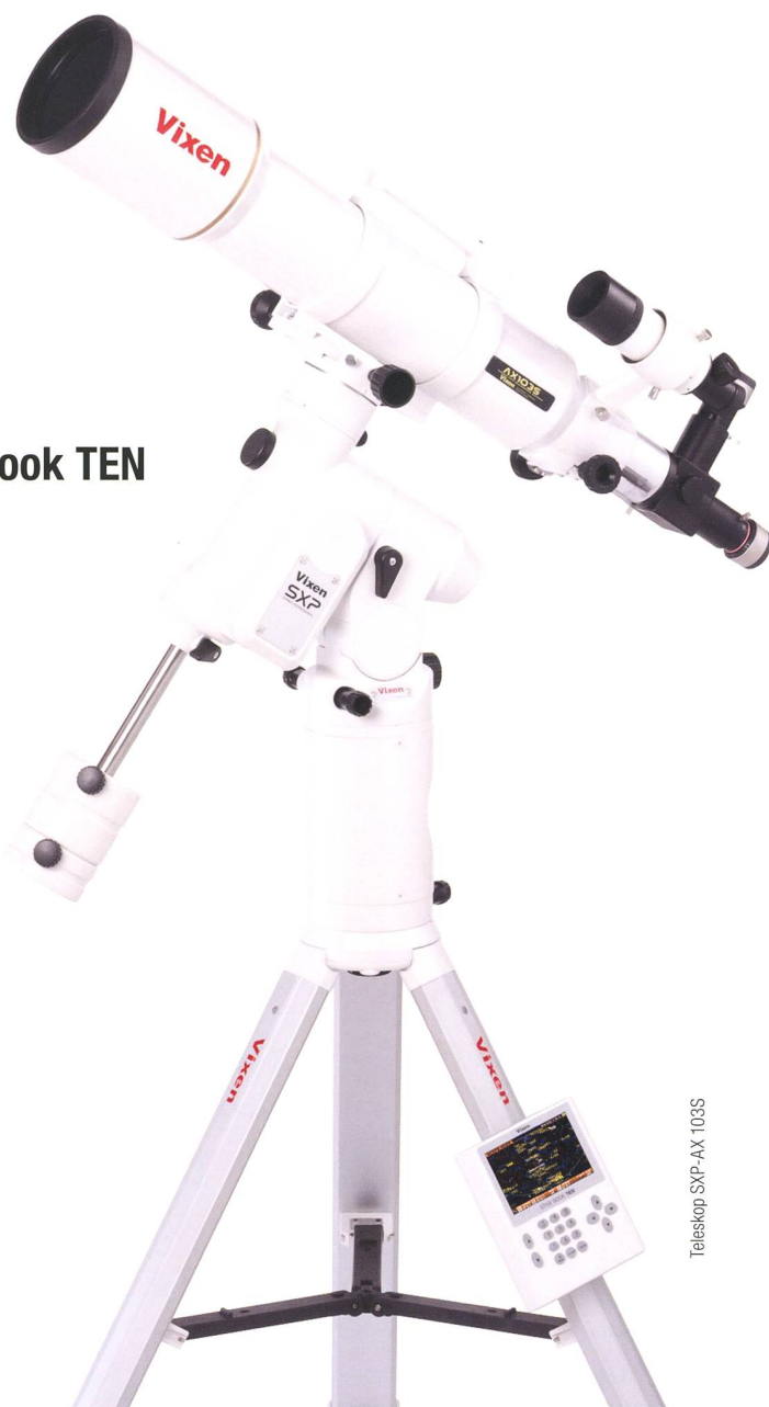
Teleskop SXP-AX 103S