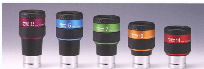
NEU: Vixen Okulare SSW 83° Ø 1 1/4", 31.7mm

Bildschärfe: Extrem scharfe Sternabbildungen über das gesamte Gesichtsfeld.