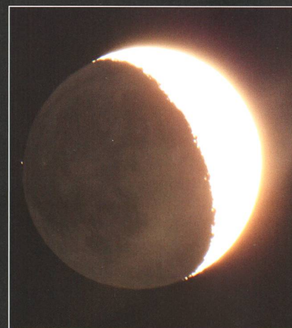
Abbildung 2: Hier nähert sich der Mond am 7. August 2016 dem +6^{\text{mag}} hellen Stern 38 Virginis.