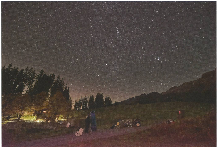
Abbildung 1: Klare Nacht mit Sternen und Teleskopen: Die Teleskope der AJB im Einsatz. In Blau der 46er und in Weiss der 30er – beides Eigenbauten. Thun stört mit seiner Lichtverschmutzung kaum.

Fuchsbau mitten im Dickicht oberhalb unserer Hütte.