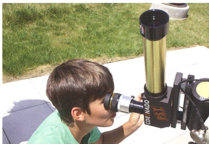
Abbildung 2: Mit dem PST (Coronado) lassen sich die Protuberanzen perfekt beobachten.

gleich zum Start der neuen Woche nach Auffahrt erleben werden. Wer hat, darf auch sein eigenes Teleskop mitbringen. Wir basteln für den Merkurtransit Sonnenfilter aus Mylarfolie.