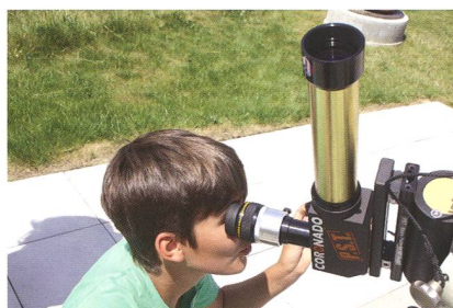
Abbildung 2: Mit dem PST (Coronado) lassen sich die Protuberanzen perfekt beobachten.

gleich zum Start der neuen Woche nach Auffahrt erleben werden. Wer hat, darf auch sein eigenes Teleskop mitbringen. Wir basteln für den Merkurtransit Sonnenfilter aus Mylarfolie.