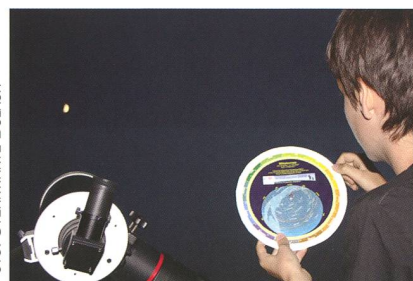
Abbildung 4: Die ORION-Sternkarte ist leicht zu bedienen. Mit ihr kannst du die Sternbilder leicht identifizieren.