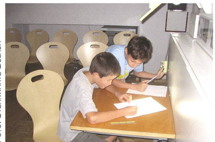
Abbildung 3: Sonnenbeobachtung am Heliostaten.