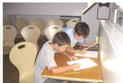
Abbildung 3: Sonnenbeobachtung am Heliostaten.