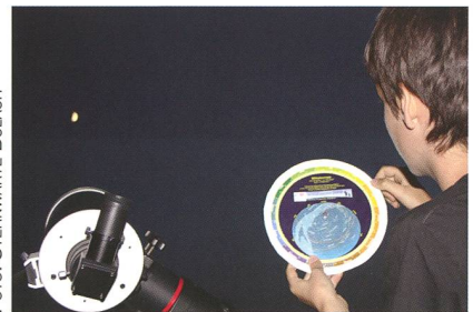
Abbildung 4: Die ORION-Sternkarte ist leicht zu bedienen. Mit ihr kannst du die Sternbilder leicht identifizieren.

Anmeldung bis spätestens 30. April 2016 unter: