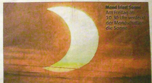
Abbildung 2: Dieser Journalist oder diese Journalistin hatte wohl definitiv einen Fensterplatz in der Physik. Was für uns Insider vielleicht zum Schmunzeln ist, löst bei Schülerinnen und Schüler fragwürdige Blicke aus. Bedenklich aber ist die Qualität dieser Art Berichterstattung! Da lohnt sich wohl einmal mehr der gute Rat, nicht immer alles zu glauben, was uns die Medien berichten. Finden Sie die Fehler!