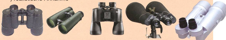
Tabelle 3: Der N^2 -Index auf verschiedene Ferngläser berechnet.