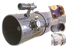
6" bis 14" Öffnung f/3 bis f/6,4

Die Ausstattungsmerkmale der UNC Newtons: