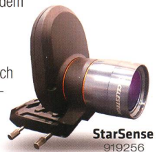
StarSense 919256 Fr. 519.-

Die AVX verfügt neben einem RS232-Anschluss auch über einen Autoguider-Eingang und zwei AUX-Anschlüsse. Hier können Sie zusätzliche, separat erhältliche Erweiterungsmodule anschliessen – zum Beispiel das SkyQ Link Modul für die Steuerung über WLAN mit iPhone/iPad/Windows-PC oder das StarSense-Modul , mit dem die Montierung ihre Referenzsterne automatisch anfährt und perfekt zentriert.