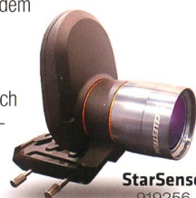
StarSense 919256 Fr. 519.-

Die AVX verfügt neben einem RS232-Anschluss auch über einen Autoguider-Eingang und zwei AUX-Anschlüsse. Hier können Sie zusätzliche, separat erhältliche Erweiterungsmodule anschliessen – zum Beispiel das SkyQ Link Modul für die Steuerung über WLAN mit iPhone/iPad/Windows-PC oder das StarSense-Modul, mit dem die Montierung ihre Referenzsterne automatisch anfährt und perfekt zentriert.